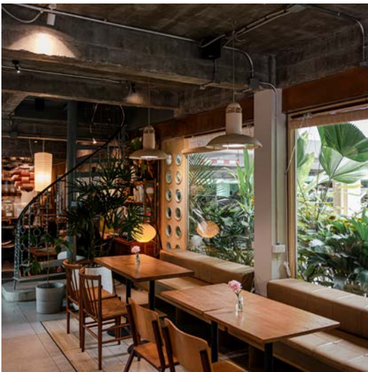
Veggiology 8 ซอยสุขุมวิท 41 (BTS สถานีพร้อมพงษ์) เปิด วันอังคาร-อาทิตย์ (ปิดวันจันทร์) เวลา 08.00-18.00 น. โทร. 08-3936-9298 www.facebook.com/veggiology.bkk

ชวนรักษ์โลกอย่างมีสไตล์ ที่ให้คุณได้เป็นส่วนหนึ่งในวิถีรักษ์โลก ตามยุคสมัยที่ใครๆ เริ่มหันมาใส่ใจสุขภาพและสิ่งแวดล้อมมากขึ้น ด้วยการเช็กอินอิมมอร์อยู่ 4 ร้านคาเฟ่ Eco-Friendly ซึ่งนอกจากจะเสิร์ฟความอร่อยให้ได้เอนจอยมื้ออาหารระหว่างวันแล้ว แต่ละร้านยังมีจุดเด่นในเรื่องของบรรยากาศที่ให้คุณได้ใกล้ชิดธรรมชาติ พ่วงด้วยการเลือกใช้ผลิตภัณฑ์และภาชนะแบบรักษ์โลก เป็นความมุ่งมั่นตั้งใจช่วยเหลือสิ่งแวดล้อมและบรรณการเรื่องการรักษาสุขภาพของคนในสังคมด้วยเครื่องดื่มและอาหารที่ใส่ใจในคุณภาพของวัตถุดิบและจ้างวงเครื่องใช้ที่ไม่เป็นการสร้างขยะเพิ่มขึ้น ส่วนจะมีคาเฟ่ร้านไหน ให้ได้ตามไปช้อป ไปชิมบ้างนั้น เตรียมเชฟลิสต์ไว้ก่อนแวะไปเช็กอินกันได้เลย