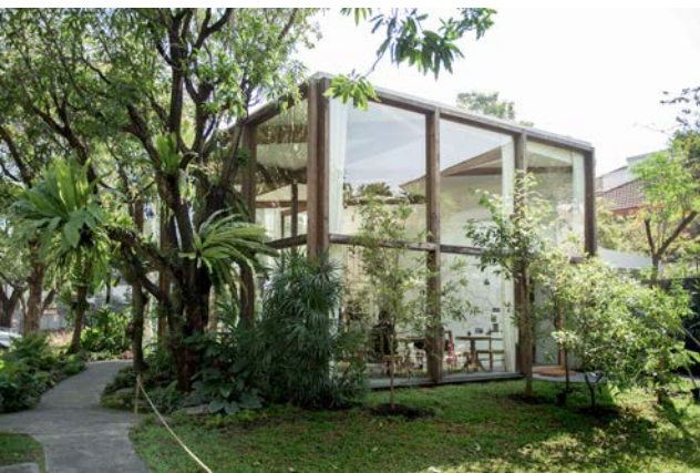
Patom ซอยสุขุมวิท 49 เปิดทุกวัน เวลา 09.00-19.00 น. โทร. 09-8259-7514 www.facebook.com/patom.organics

ออร์แกนิกคาเฟ่ใจกลางทองหล่อ กลาสเฮาส์แสนอบอุ่นที่รายล้อมด้วยพื้นที่สีเขียวสุดร่มรื่น ภายใต้คอนเซ็ปต์ Organic Living เน้นเสิร์ฟเมนูสุขภาพ ผัก และผลไม้ ด้วยวัตถุดิบออร์แกนิกมาตรฐานสากลจากกลุ่มเกษตรกรในมูลนิธิสังคมสุขใจ หลากหลายเมนูเพื่อสุขภาพทานง่าย ทางร้านจะปรุงสดใหม่ทุกวัน ด้วยวัตถุดิบออร์แกนิกมาตรฐานสากลจากกลุ่มเกษตรกร นอกจากนี้ภายในร้านยังมีจำหน่ายผลิตภัณฑ์จากวัตถุดิบธรรมชาติ ทั้งสบู่ ยาระพม ลิปบาล์ม และยาอดม ให้ได้เลือกช้อปกันอีกด้วย