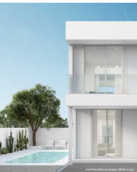
ภาพจำลองโครงการเอเร็น เอ็กซ์ บ้านนา