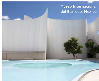
Museo Internacional del Barroco, Mexico

ข้ามไปยังทวีปอเมริกาเหนือกันต่อเลยกับ พิพิธภัณฑ์ศิลปะนานาชาติบาโรก 'Museo Internacional del Barroco, Mexico' ผลงานการออกแบบโดยสถาปนิกชาวญี่ปุ่น Toyo Ito ที่ดีไซน์ตัวอาคารด้วยสีขาวเป็นหลัก เน้นความโค้งมนคล้ายเกลียวคลื่น ภายในมีคอร์ทยาร์ดน้ำพุทรงกลมหมุนวนเลียนแบบการไหลเวียนของน้ำ นับว่าที่นี่คือหนึ่งในจุดหมายสำหรับชาวมินิมอลลิสต์ที่พลาดไม่ได้