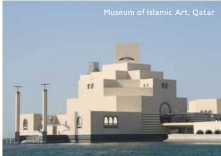
Museum of Islamic Art, Qatar

สายเที่ยวเตรียมเช็กลิสต์ให้พร้อม เพราะคอลัมน์นี้อารมณ์จะพาคุณ ลัดฟ้าออกไปค้นหาแรงบันดาลใจให้คุณคลั่งไคล้ในดีไซน์มินิมอลขึ้นไปอีกขั้น กับสถาปัตยกรรมสไตล์มินิมอลที่เน้นเส้นสายรูปทรงเรขาคณิต โครงสร้างเปิดโล่ง ใช้แสงธรรมชาติในการเสริมให้ตัวอาคารเห็นจนอยากอินสไปร์มาไว้ที่บ้านตัวเอง