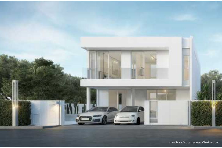
ภาพจำลองโครงการเอเร็น เอ็กซ์ บ้านนา