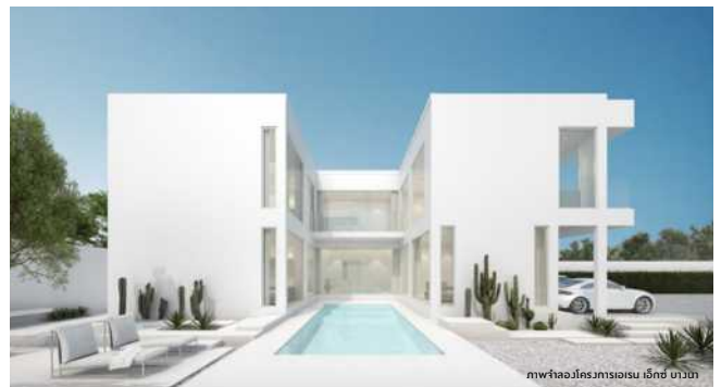
ภาพจำลองโครงการเอเร็น เอ็กซ์ บ้านนา