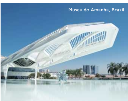
Museu do Amanha, Brazil

ข้ามไปยังทวีปอเมริกาเหนือกันต่อเลยกับ พิพิธภัณฑ์ศิลปะนานาชาติบาโรก 'Museo Internacional del Barroco, Mexico' ผลงานการออกแบบโดยสถาปนิกชาวญี่ปุ่น Toyo Ito ที่ดีไซน์ตัวอาคารด้วยสีขาวเป็นหลัก เน้นความโค้งมนคล้ายเกลียวคลื่น ภายในมีคอร์ทยาร์ดน้ำพุทรงกลมหมุนวนเลียนแบบการไหลเวียนของน้ำ นับว่าที่นี่คือหนึ่งในจุดหมายสำหรับชาวมินิมอลลิสต์ที่พลาดไม่ได้